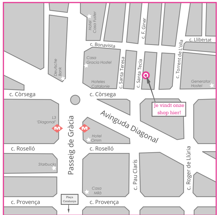
Cruising Barcelona · c. Santa Tecla 7 · 08012 Barcelona telefoon: (0034) 935 187 533